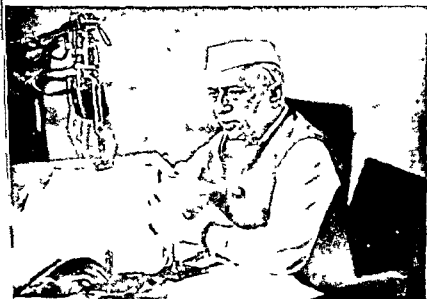
To the nation after signature on 1/21 (Song 70)